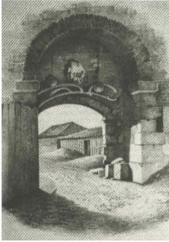
Görsel 4: Edirne kale kapısında asılı iki topuz (Acar & Özveri, 260).

Günümüzde bu gürzlerin halen süren örneği, İstanbul surları Silivrikapı üzerinde görülmektedir. Kapının şehir tarafında, Hadım İbrahim Paşa Camii'ne bakan kısmında, 2,5 m. yükseklikte, demir bir sapın ucunda yanlarında iki zincirle asılı bir küre yer almaktadır. Dikkatlice bakıldığında bir gürz olduğu anlaşılan bu küreyi altında bulunan kitabesi de doğrulamakta ve 1630 yılında Zaralı İdris pehlivana ait olduğundan bahsedilmektedir. Kitabe şöyledir: