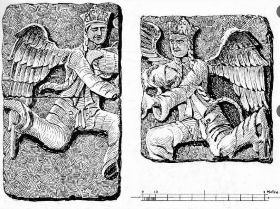
Görsel 2: Kreyker tarafından çizilen melek figürleri (Atçeken & Bedirhan, 2012).