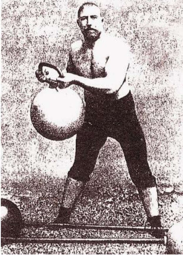
Görsel 7: Osmanlı dönemi güreşçilerinin idman güllerini (giryâ) ile çalıştıkları bilinmektedir (Cannar, 2013).

Tarihi Konya kapılarından pazar kapısı üzerinde zincirle asılı kürelerin birer pehlivan gürzü olma olasılığı oldukça kuvvetlenmektedir. Ancak Sur kapılarına asılan kahramanlık unsurları bu kadarla sınırlı değildir. Söz konusu olan sadece küreler olsa bile bunu kesin bir ifadeyle söyleyemiyoruz. Bize farklı seçeneklerin de olabileceği düşüncesine iten sebep Antalya Kalesi kuzey kapısına zincirle asıldığı rivayet edilen top güllüsüdür.