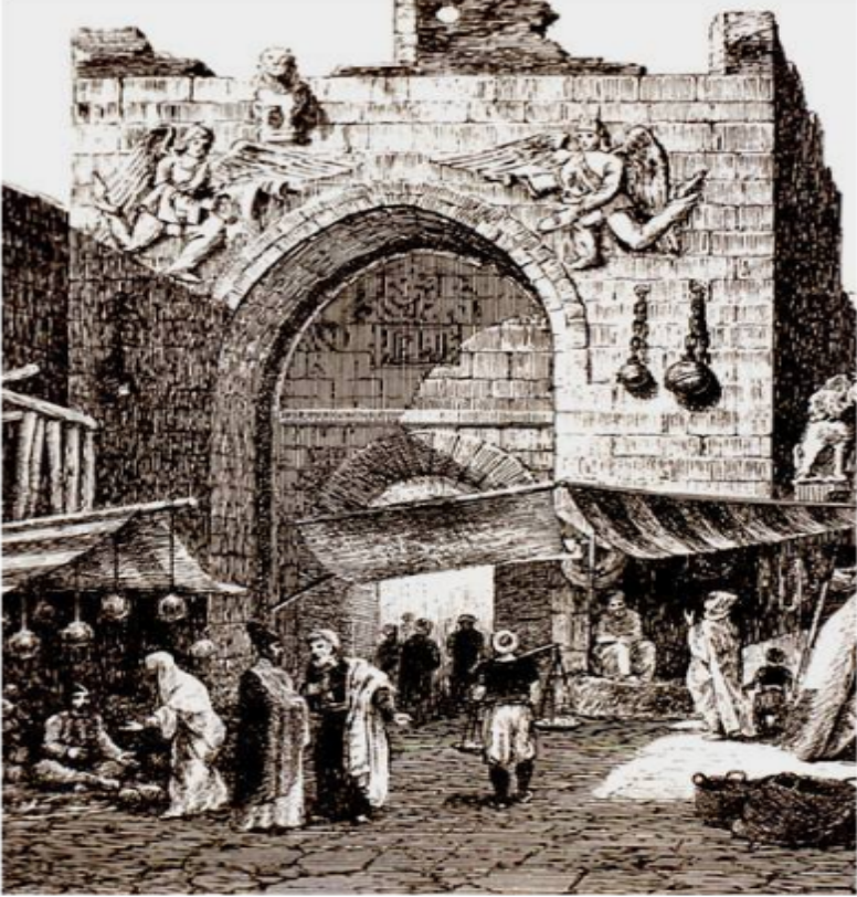
Görsel 1: C. Texier'in 1828 tarihinde çizdiği Pazar Kapısı gravürü (Sarre, 1989, s. 2).