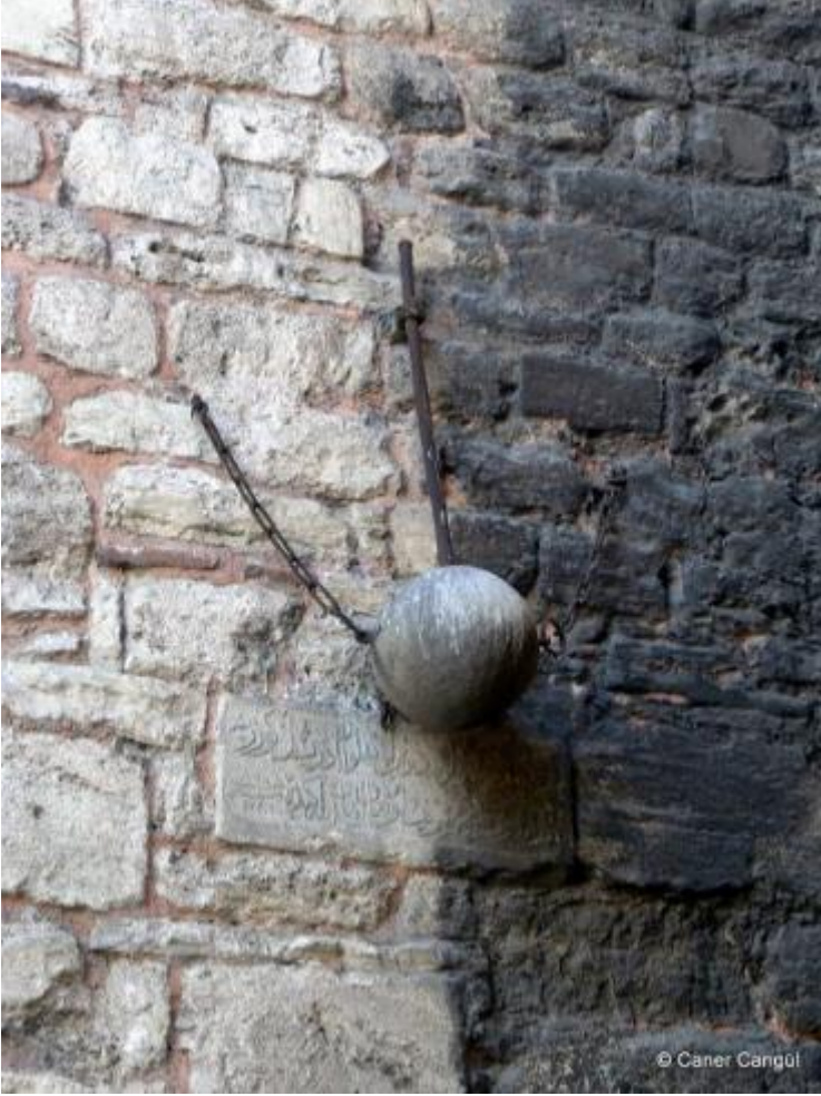
Görsel 5: Silivrikapı üzerinde asılı duran gürzden bir görsel

Osmanlı devlet teşkilatında, sarayların muhafız kıtalarında istihdam edilen ve muhtemelen iriyarı bir yeniçeri askeri olan İdris pehlivanın gürzünün buraya asılma sebebi müsabakalarda göstermiş olduğu başarıdır (Güldal, 2016).