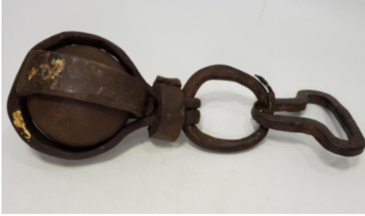
Görsel 6: Osmanlı dönemi mührüne sahip bir pehlivan güllesi (giry).

Evliya Çelebi'nin verdiği bilgiler, Osmanlı ve Selçuklu dönemi uygulamalarının sürekliliğini ortaya koymaktadır. Evliya Çelebi Budin Kalesi'nin orta hisarı Beç (Viyana) kapısının iç yüzündeki kemerlerde demir zincirlerle asılı bulunan, Sultan IV. Murad'ın altı tanesini üst üste koyup hıştla deldiği kalkanların yanında, Gazi Gürz İlyas Baba'nın 100 okkalık (128 kg) bir topuzunun ve her biri 10'ar okka (12,8 kg) gelir 16 bilyeli eşi görülmemiş büyüklükte dev bir salığının bulunduğunu; Kemah Kalesi'nin kemeri üstünde de bir başka pehlivan güzünün asılı olduğunu yazmaktadır (Kahraman, 2010).